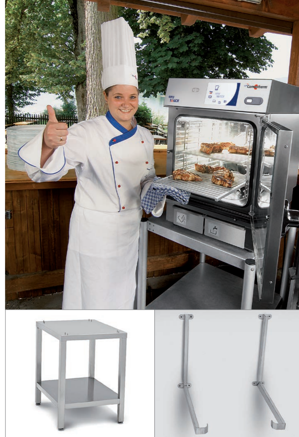
Untergestelle passend zu jedem mini