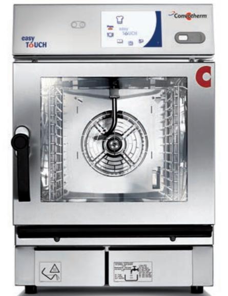
6.06 mini mobil 6 x 2/3 GN 6.10 mini mobil 6 x 1/1 GN