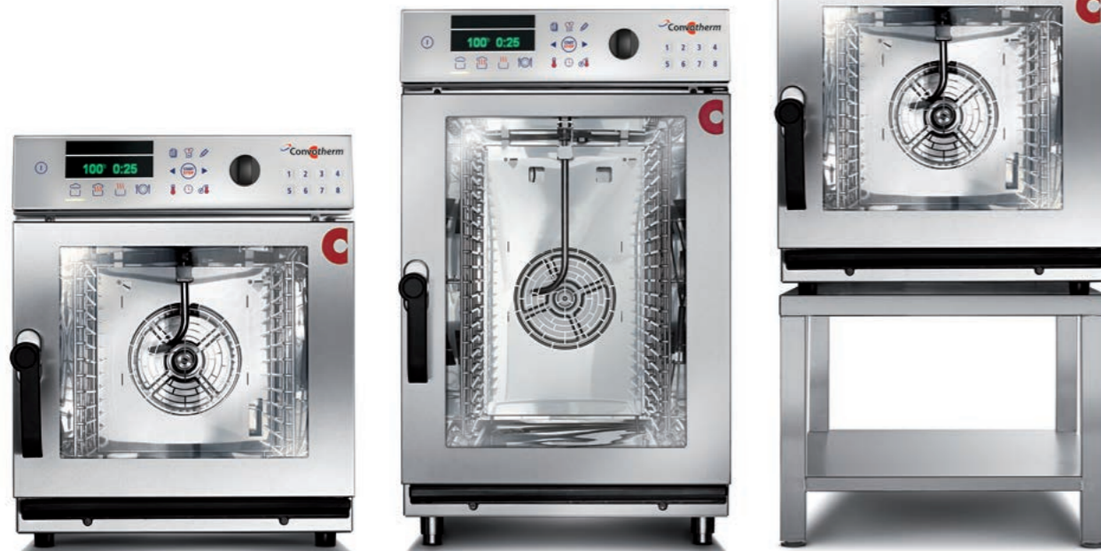
6.06 mini (6 x 2/3 GN) – auch mobil 6.10 mini (6 x 1/1 GN) – auch mobil

Zu unserer mini Serie gehören Kombidämpfer in vier verschiedenen Größen: