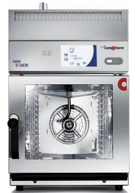
ConvoVent mini Kondensationshaube; ideal für Frontcooking.