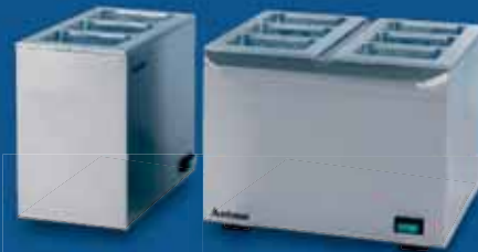
Tetrapackerhitzer geeignet für drei und sechs Tetrapack je ein Liter.