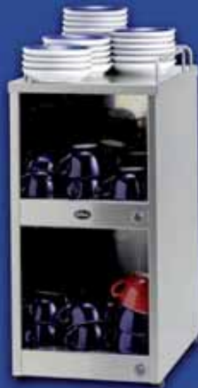
KKWn Tassenwärmer incl. Untertassenhalter. Etagen getrennt einschaltbar.