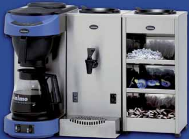
ZUTATENBEHÄLTER Zutatenbehälter ist aus Edelstahl mit drei Etagen für z.B. Zucker, Milch, Sahne oder Teebeutel.