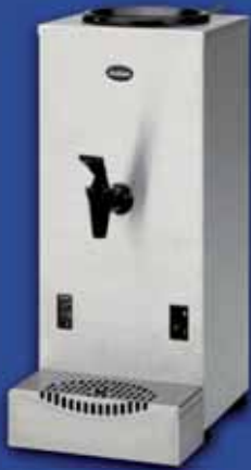
WKT3n Wasserkocher 3 Liter mit oder ohne Wasseranschluß

Für die M-Line sind die folgenden Optionen und Zubehör lieferbar: