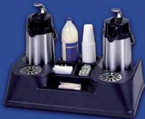
SERVIERSTATION Servierstation für 2 Pumpkannen 2,1 oder 2,2 Ltr. incl. Abstellfläche für Tassen.