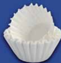
FILTERPAPIER Umweltfreundliches Korbfilterpapier 90/250, sauerstoffgebleicht.