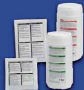
LÖSUNGSMITTEL Entkalkungs- und Kaffeensatzlösungsmittel. Erhältlich in Beuteln oder kg Dosen.